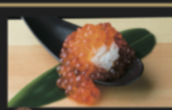
たっぷり豪快!イクラちかっぱ盛り 880円(税込968円)