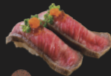
炙り佐賀牛ロースビーフ 590円(税込649円)