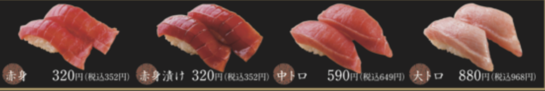
赤身 320円(税込352円) 赤身漬け 320円(税込352円) 中トロ 590円(税込649円) 大トロ 880円(税込968円)