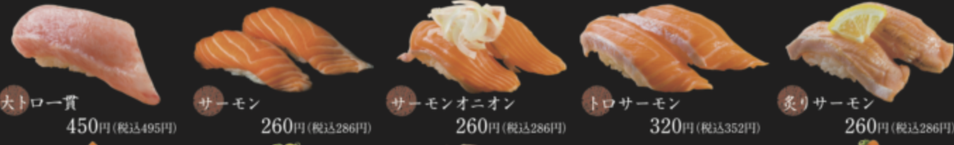
大トロ一貫 450円(税込495円) サーモン 260円(税込286円) サーモンオニオン 260円(税込286円) トロサーモン 320円(税込352円) 炙りサーモン 260円(税込286円)