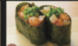
海鮮軍艦 320円(税込352円)