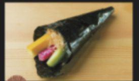
本日の糸島野菜の浅漬け手巻き 260円(税込286円)