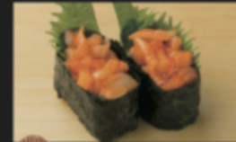
イカ明太軍艦 200円(税込220円)