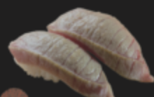
炙り中トロ 590円(税込649円)