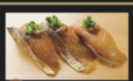
胡麻握り三味(サバ・アジ・カンパチ) 450円(税込495円)