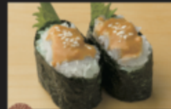
ごまイカ軍艦 260円(税込286円)