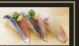
博多青もん三味(サバ・アジ・カンパチ) 450円(税込495円)