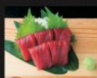
木ノグロ赤身お造り 880円(税込968円)