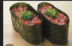
馬ユッケ軍艦 680円(税込748円)