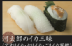
河太郎のイカ三味 (アオリイカ・ヤリイカ・ごまイカ軍艦) 450円(税込495円)