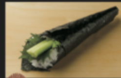
カッパ手巻き 140円(税込154円)