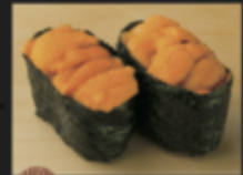
ウニ軍艦 880円(税込968円)