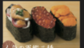
人気の軍艦三種 (ごまサバ・イクラ・ウニ) 880円(税込968円)