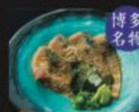
ごまサバ(刺身) 450円(税込495円)