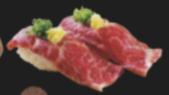
熊本産霜降り馬握り 1,000円(税込1,100円)