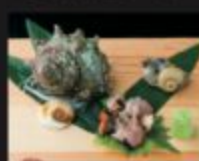
サザエお造り 590円(税込649円)