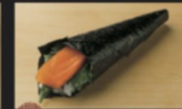
サーモン手巻き 260円(税込286円)