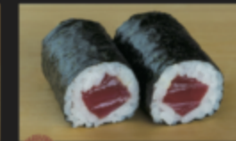
長崎本マグロの鉄火巻 390円(税込429円)