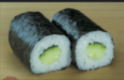
カッパ巻 140円(税込154円)