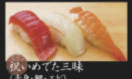
祝いめでた三味 (赤身・鯛・エビ) 590円(税込649円)