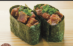
佐賀牛ユッケ軍艦 680円(税込748円)