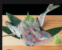
アジの姿造り 1,000円(税込1,100円)