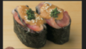
ごまサバ軍艦 260円(税込286円)