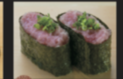
ネギトロ軍艦 260円(税込286円)