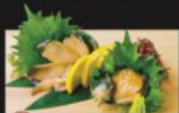
姫アワビお造り 1,000円(税込1,100円)