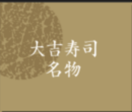
大吉寿司 名物 呼子白もん三味 (天然鯛・アラ・ヤリイカ) 880円(税込968円)