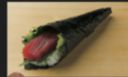
鉄火手巻き 390円(税込429円)