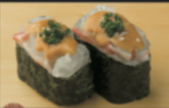
ごまタイ軍艦 320円(税込352円)