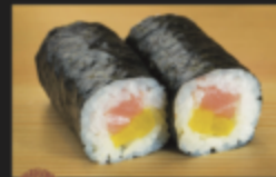
トロたく巻 680円(税込748円)