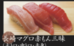
長崎マグロ赤もん三味 (大トロ・中トロ・赤身) 880円(税込968円)