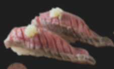
柔らか牛タンの炙り 590円(税込649円)