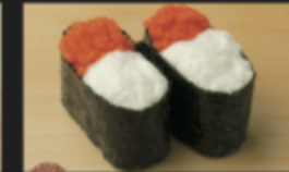
明太トロ口軍艦 200円(税込220円)