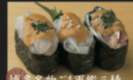
博多名物ごま軍艦三種 (ごまタイ・ごまイカ・ごまサバ) 450円(税込495円)