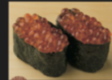
イクラ軍艦 590円(税込649円)