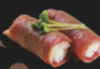
炙り佐賀牛サーロイン 1,000円(税込1,100円)