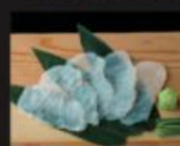
アラお造り 1,450円(税込1,595円)