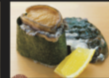
活き姫アワビのおどり軍艦 450円(税込495円)