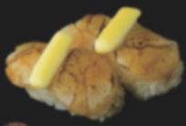
ホタテの炙りバター醤油 390円(税込429円)