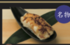
名物 名物ふわふわ蒸し穴子 590円(税込649円)