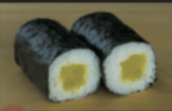
おしんこ巻き 140円(税込154円)