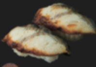
炙りうなぎ 450円(税込495円)