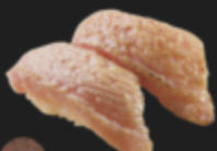
炙り大トロ 880円(税込968円)